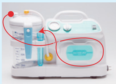
吸引チューブを本体に収納