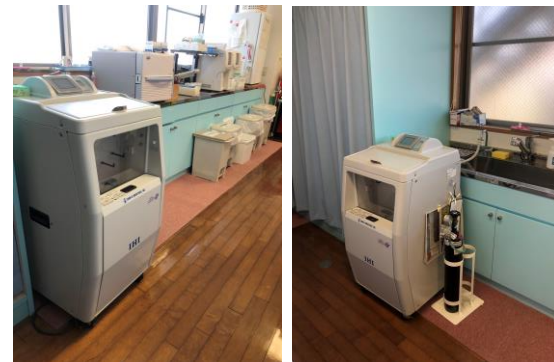
↑ オゾン水内視鏡消毒機 OED-1000S: 2014年設置。 ・OED-1000Sの給排水元であるシンクの 前に設置。シンクの前に置いても出っ張りが 少なく作業導線の邪魔にならないサイズです。