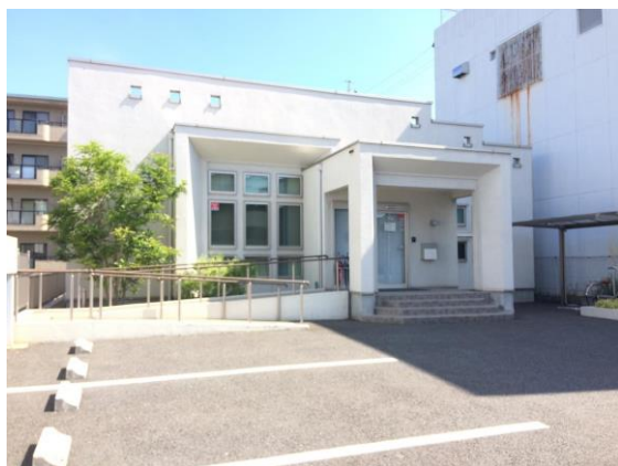
瀧消化器内科クリニック様外観

やはりランニングコストが低いと実感しています。開業医としては経営面でもメリットが大きいです。